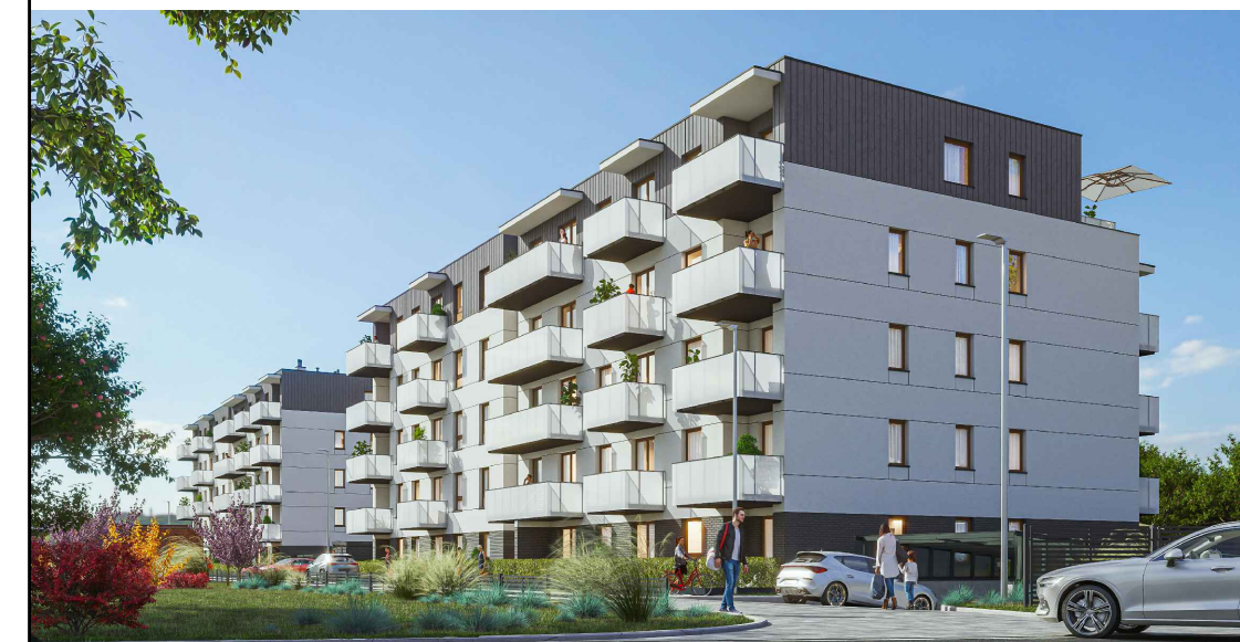
POŁOŻENIE MIESZKANIA W BUDYNKU